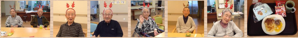
あじさい・まつば ユニットでクリスマス会にホットケーキパーティーを開催、ピングゲームなどをしました。