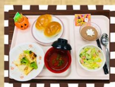
ハロウィーンランチ