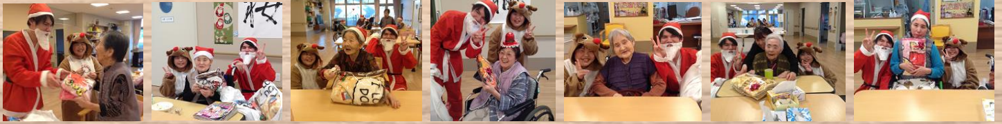
さくら・かえで サンタとトナカイが素敵なプレゼントを持ってきてくれました♪