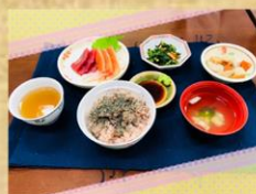
お誕生日ランチ (11月)