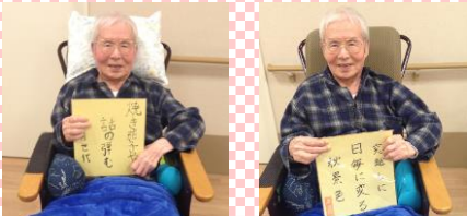
入選作品 「焼き茄子や 話の弾む同世代」