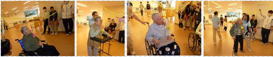
11月14日(水曜日)に4階4ユニット合同で運動会を行いました！！種目は「風船バレー」「玉入れ」「リレー」「パン食い競争」の4種目で、入居者様1人1人が真剣にまた楽しく競技に取り組まれている様子を見て、幾つになっても運動会は良いことだなと感じました。入居者様の普段と違う様子や笑顔が多く見られ良い時間を一緒に過ごせました。