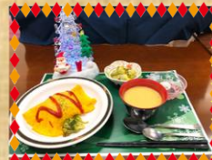
クリスマスランチ & クリスマスケーキ