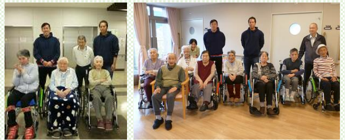
12月の某日、同敷地内にある帝京大学硬式野球部寮に来ていたところ、みどりの丘にも来てくださり、記念撮影をさせていただきました。