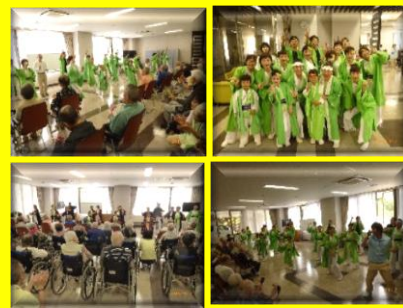
6/7 よさこいのご様子

よさこい踊りをはじめ様々なパフォーマンスに圧倒されていましたが、最後は手拍子をされたり、鳴子を振って皆様も参加されていました。