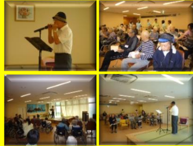
5/6 ハーモニカ演奏隊のご様子

巧みなハーモニカの音色に皆様聞き入っておいりました。施設での初めてのボランティア活動でした。