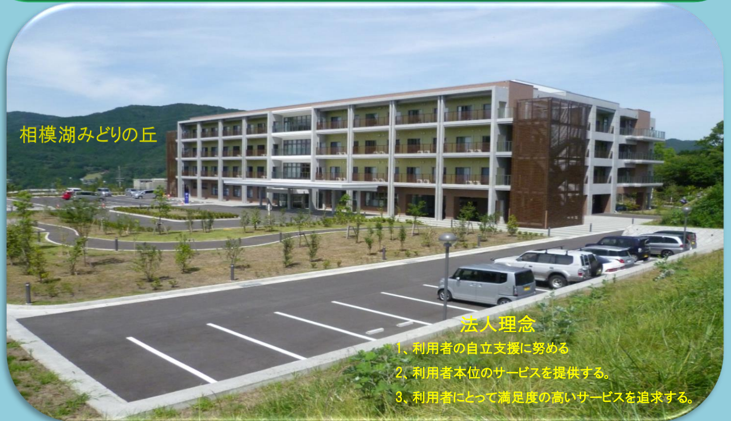
相模湖みどりの丘

社会福祉法人 寿栄会 特別養護老人ホーム 相模湖みどりの丘 〒神奈川県相模原市緑区寸沢嵐1019-8 TEL 042-685-1165(代)