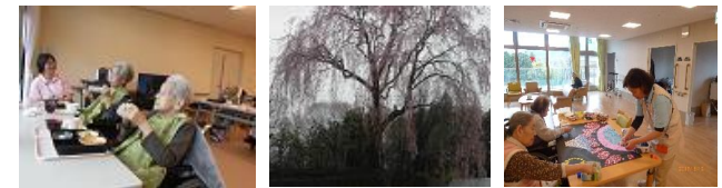
施設の敷地内にある枝垂桜