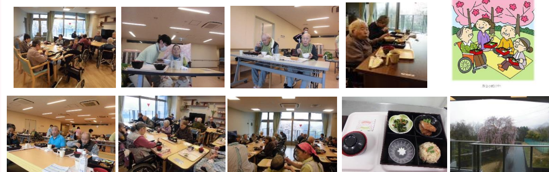
施設から見える枝垂桜を見ながらのお花見弁当を楽しみました。