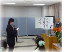
新卒の職員 2 名ほか新たな職員を迎えて…