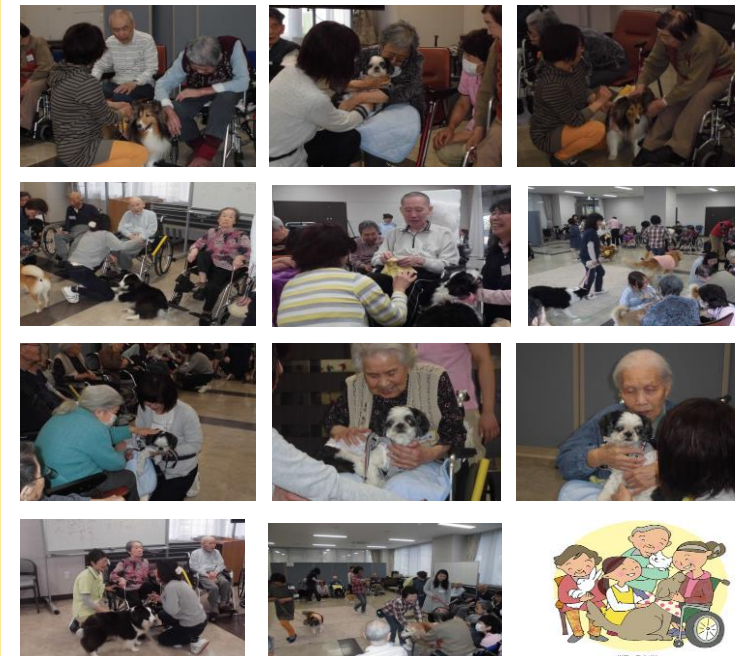
恒例のドッグセラピーを開催。